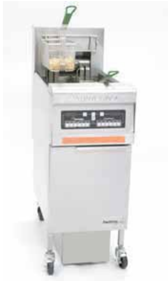
FPRE114 图示型号 FPRE114CSE